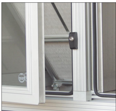
Rys. 4. Okno inspekcyjne w szafie klimatyzacyjnej [9]

4 100±5 140 mm, głębokość 840±1300 mm oraz wysokość 1 950 mm.