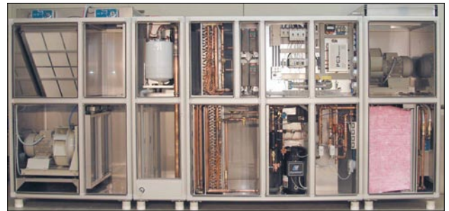
Rys. 1. Szafa klimatyzacyjna zaprojektowana do klimatyzacji sal operacyjnych [9]

W przypadku braku miejsca możliwa jest rezygnacja z modułu nawilżania znajdującego się w szafie i zainstalowanie w przewodach wentylacyjnych parowego nawilżacza kanałowego.