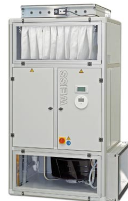
Rys. 4. Jednomodułowa szafa klimatyzacyjna