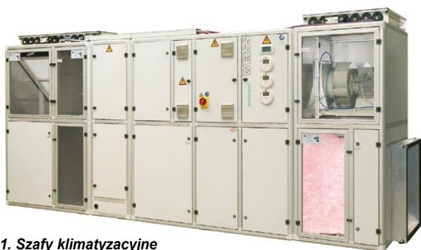
Rys. 1. Szafy klimatyzacyjne Mediclean w wykonaniu higienicznym